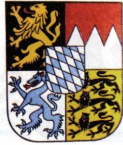
Das bayerische Wappen

Ob wir nun eine Handschrift oder ein Siegel, ein Rathaus oder eine Residenz, eine Burg, eine Kirche oder ein Stadttor betrachten - auf eines werden wir immer stoßen: Wappen. Sie stellen den Forschungsgegenstand der Heraldik dar. Unter Heraldik versteht man die Lehre vom Wappenrecht, von den Wappendarstellungen und von der Geschichte des Wappenwesens.